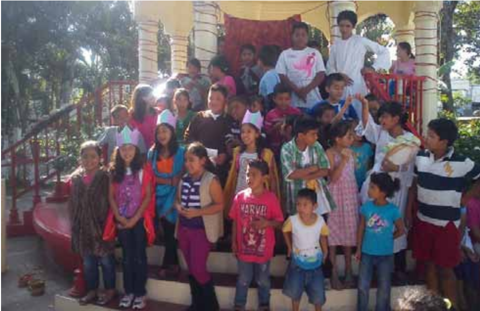
Niños preparándose para cantar un villancico.