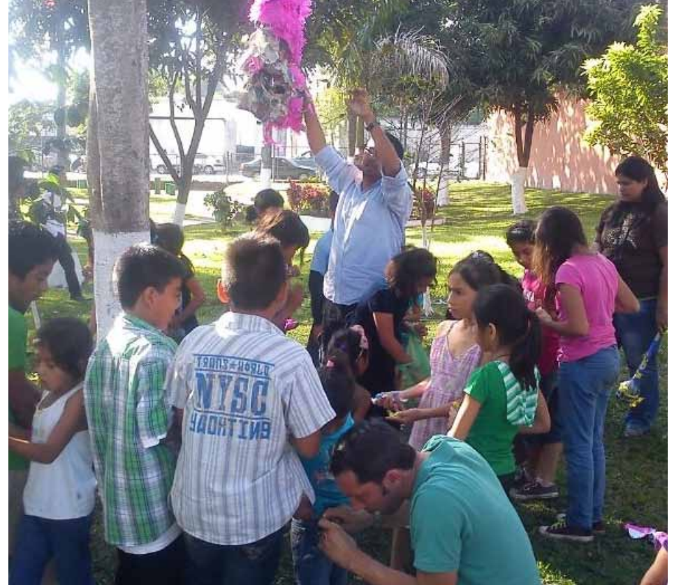
Los niños disfrutaron de las piñatas y dulces.