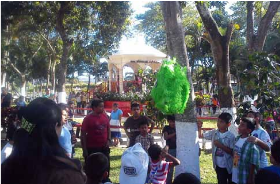
los más pequeños dieron apertura con la piñata de los niños.