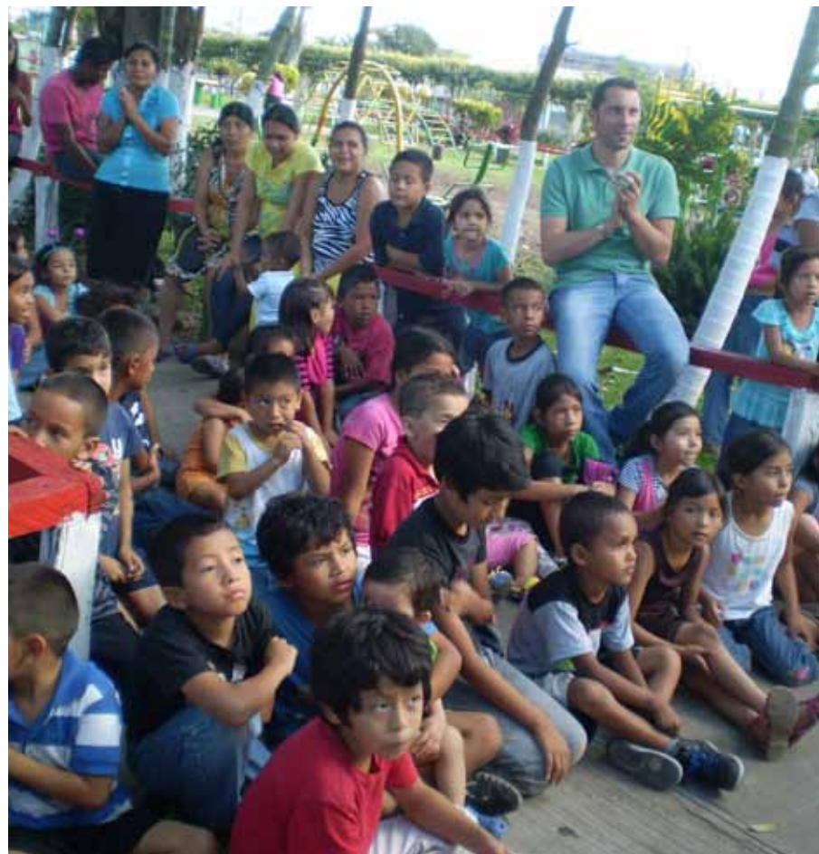
Niños y voluntarios atentos a la presentación de la pastorela.

En el mes de diciembre, se realizaron dos días de festejos Navideños durante los cuales los niños presentaron una pastorela y villancicos, preparados por los voluntarios de FUNDIPRO; además los pequeños disfrutaron de dulces, piñatas, pizza, pastel, juegos y regalos.