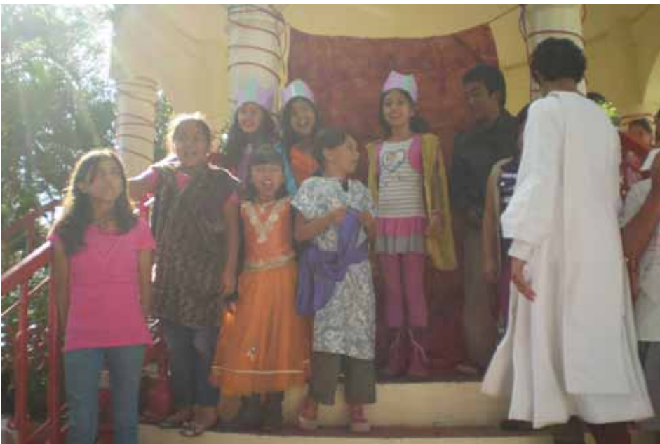
Niños cantando villancico "Venid pastorcillos".