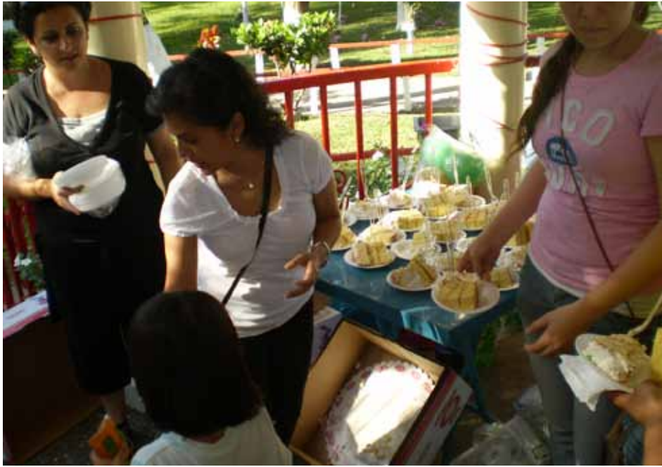
Los voluntarios repartieron pastel a los pequeños.