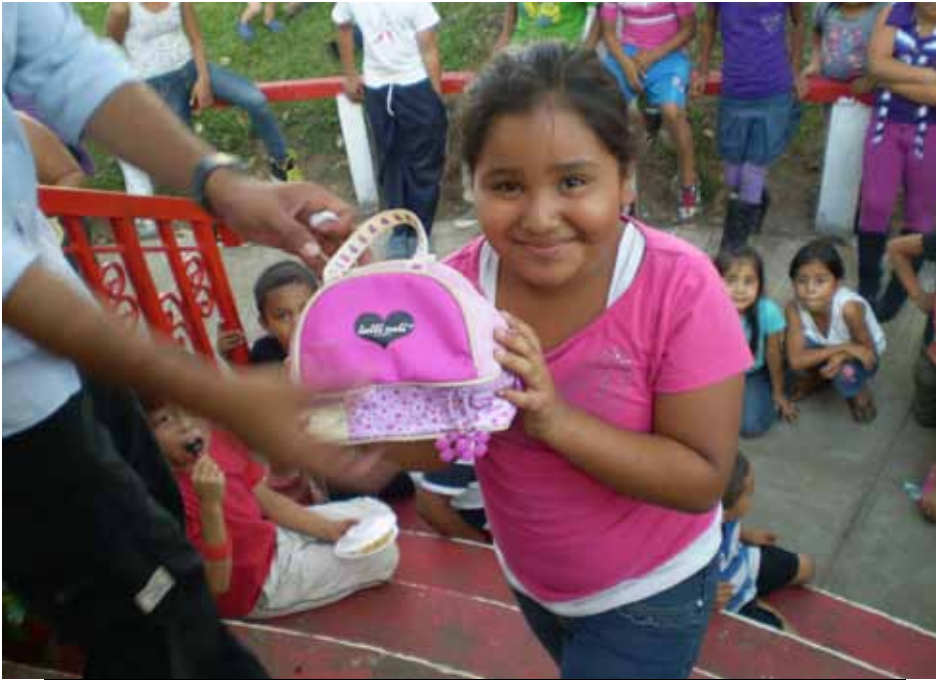
Todos los niños recibieron regalos.

Niños de la guardería "Las Abejitas", en el año 2003; quienes, luego de once años, seguramente no se olvidan de los voluntarios/amigos de la guardería con los cuales crecieron.